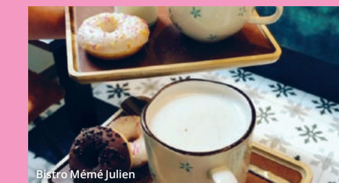
Bistro Mémé Julien