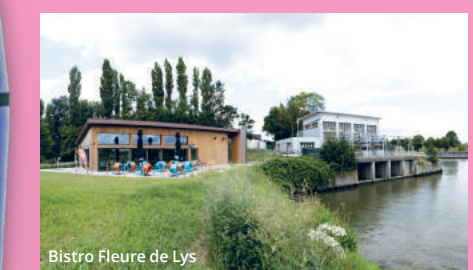
Bistro Fleure de Lys